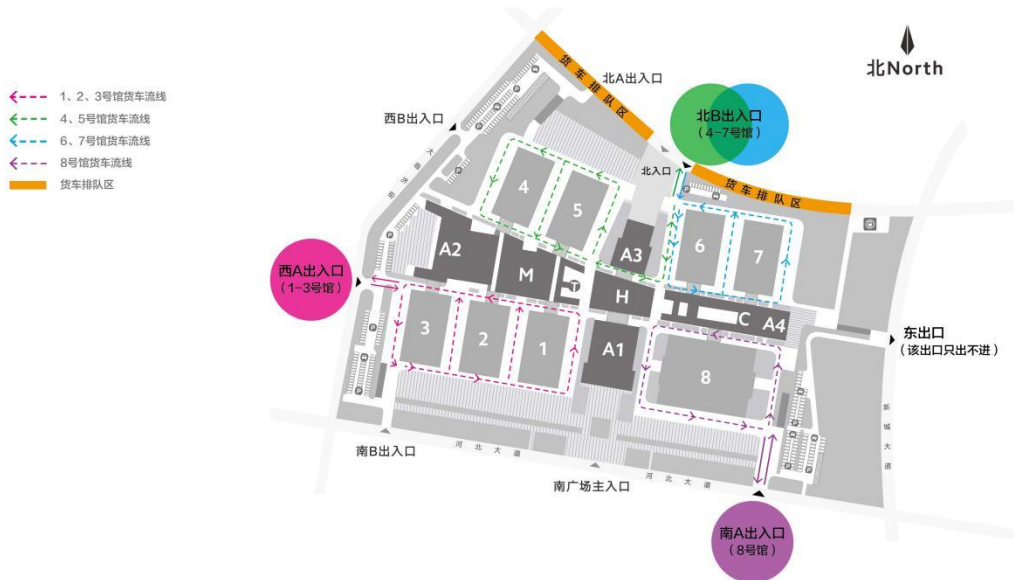
展馆货运车辆等候及行驶方案